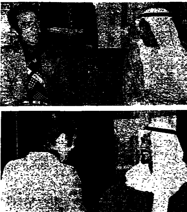
استقبل امير الكويت الشيخ صباح السالم الصباح ، وولي العهد ورئيس الحكومة الشيخ جابر الاحمد امس الاول ، الرئيس كمال الاسعد

استقبل امير الكويت الشيخ صباح السالم الصباح ، وولي العهد ورئيس الحكومة الشيخ جابر الاحمد امس الاول ، الرئيس كمال الاسعد الذي نقل الى الشيخ صباح رسالة من الرئيس فرنجة ، وفي الصورة ( فوق ) يدعو امير الكويت الشيخ صباح السالم الصباح ، وفي الصورة الثانية يدعو مع الشيخ جابر